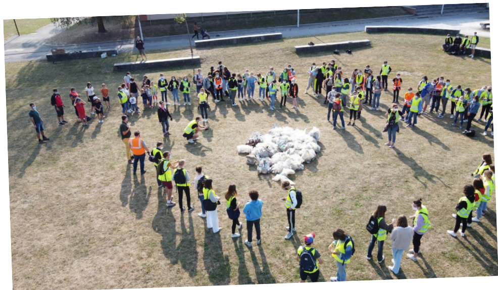
Cleanup dans le lycée de Gondécourt, 2020.