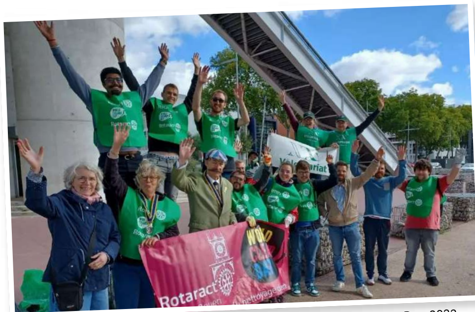
Les membres du Rotaract de Rouen pendant la semaine du World Cleanup Day, 2022