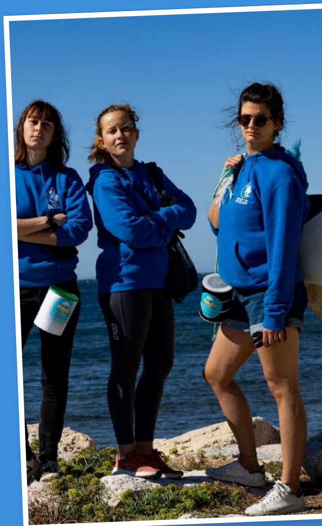
Cleanup sur le bord de mer de Sausset-les-Pins, 2022

Inscription et adhésion sur www.worldcleanupday.fr