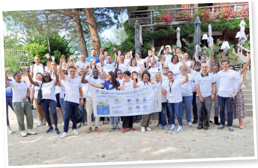
Les membres d'Initiatives Océanes pendant la semaine du World Cleanup Day, 2023