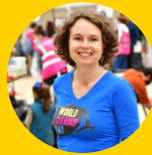
VIRGINIE DELUGEARD-GUÉRIN, PRÉSIDENTE WORLD CLEANUP DAY - FRANCE