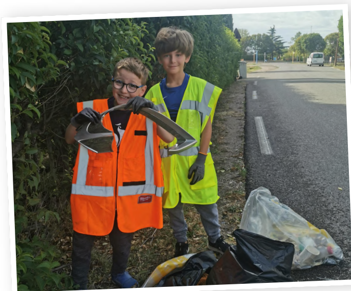
Ramassage de déchets dans le cadre du World Cleanup Day 2023

World Cleanup Day - France 25 rue Saint-Jacques, 59800 Lille contact@worldcleanupday.fr 09 72 63 35 33