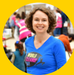
VIRGINIE DELUGEARD-GUÉRIN, PRÉSIDENTE WORLD CLEANUP DAY - FRANCE